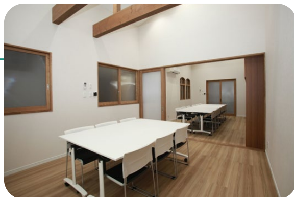
みゆき生活舎内の相談室