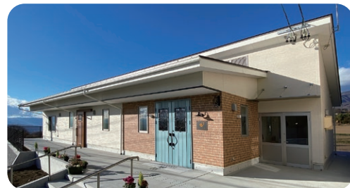
パン工房「ふっくら」