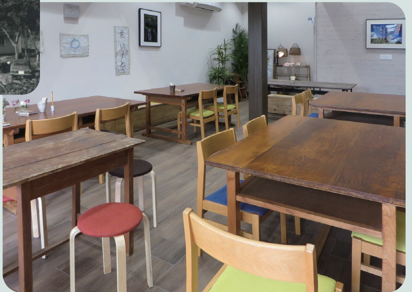
▲ 地域交流カフェ こひつじ ▲