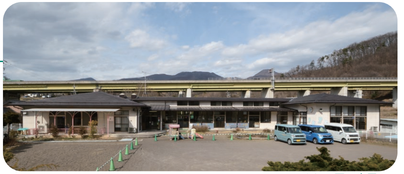
ひまわり園・全景

小諸市役所 (保健福祉部厚生課) TEL 0267(22)1700 FAX 0267(22)1966)