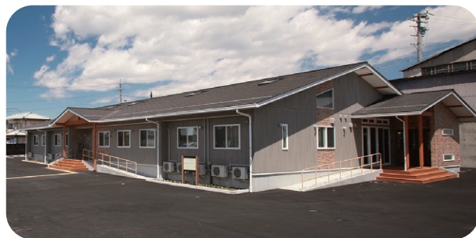
みゆき生活舎(左側)、地域交流カフェ こひつじ(右側)

〒384-0005 長野県小諸市御幸町一丁目5番24号 TEL 0267-31-6210 / FAX 0267-25-3530