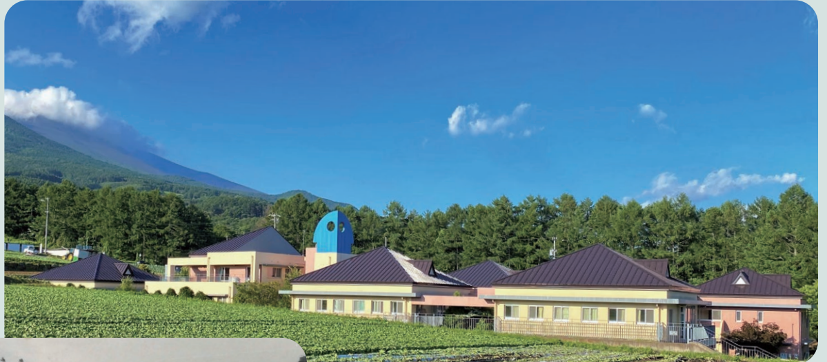
現在の小諸学舎 ▲ ◀ 1972年「小諸学舎」開舎当時のようす

法人理念 いちこう 一羔なる思い ～精神を尽くし、心を尽くし、思いを尽くし、力を尽くす～